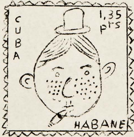
NUEVA COLECCION DE SELLOS (Informaremos a quien le interese)