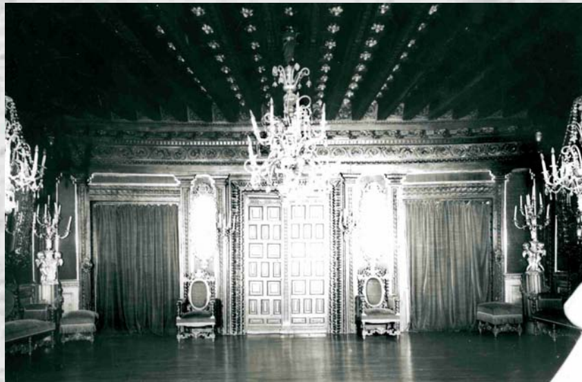
Ispiluen Gela - Salón de los Espejos

Durante unos días, el palacio fue ocupado por el pretendiente al trono Carlos María de Borbón y Austria-Este. El día seis de ese mes, Don Carlos redactaba en Deba un manifiesto que ha pasado a la historia como "Manifiesto de Deva" y que fue firmado en el salón que hoy se conoce como "de los espejos". En este salón tuvo lugar la recepción de Don Carlos al pueblo de Deba y el acto del besamanos.