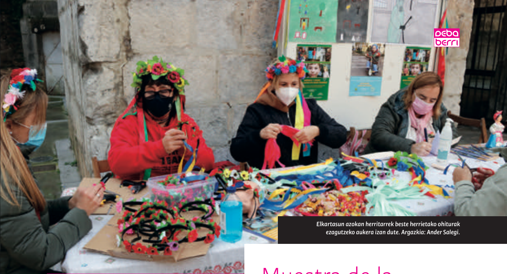
Elkartasun azokan herritarrek beste herrietako ohiturak ezagutzeko aukera izan dute.

“Hainbat proiektu lagundu dira Debako udalaren kooperaziorako laguntzen bitartez, herriaren elkartasuna adieraziz”