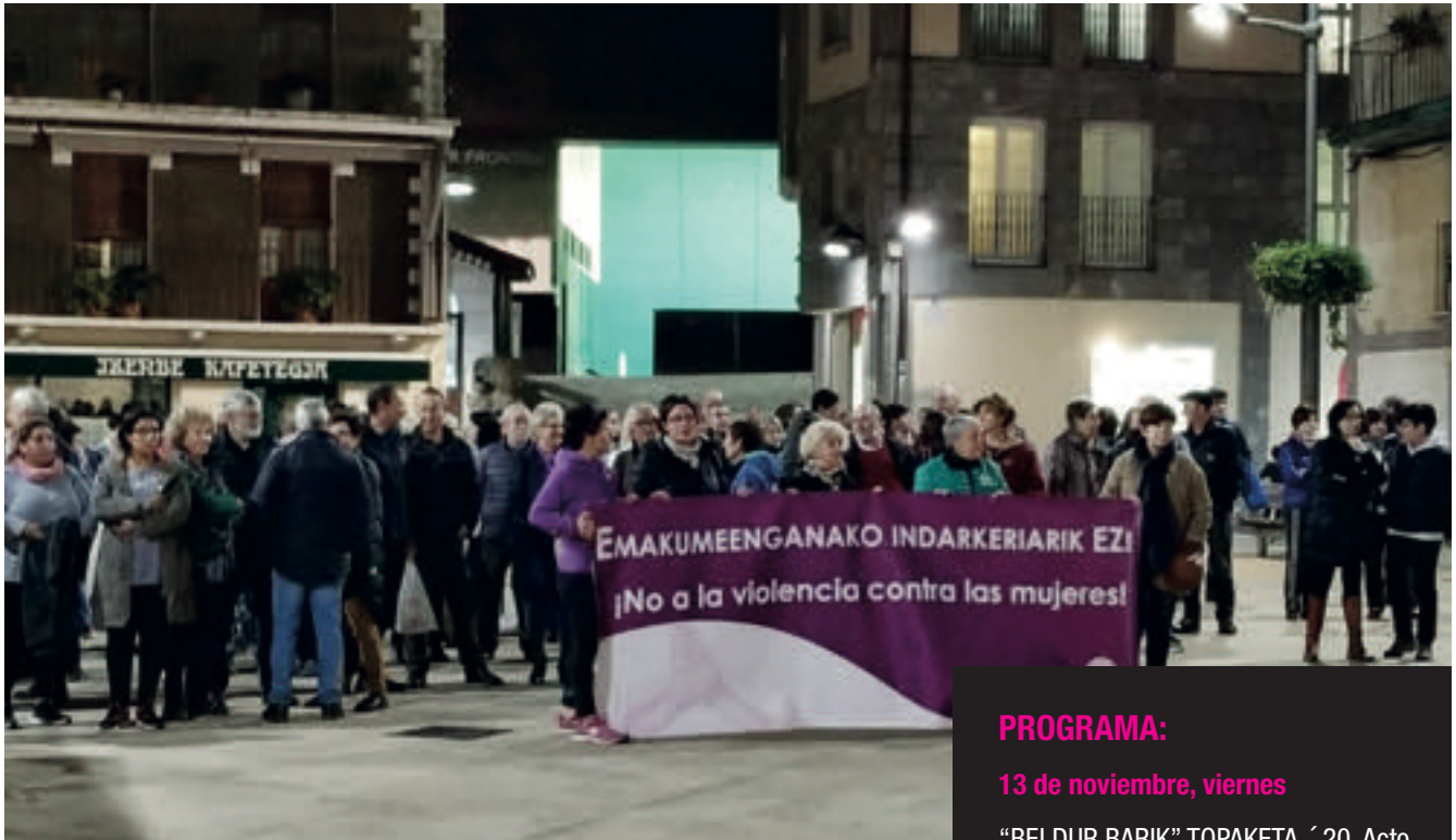
El Ayuntamiento de deba hace un llamamiento a la ciudadanía a que participe en los actos organizados en el contexto del 25 de noviembre.