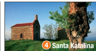
4 Santa Katalina