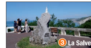
3 La Salve