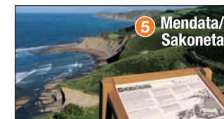
5 Mendata/ Sakoneta