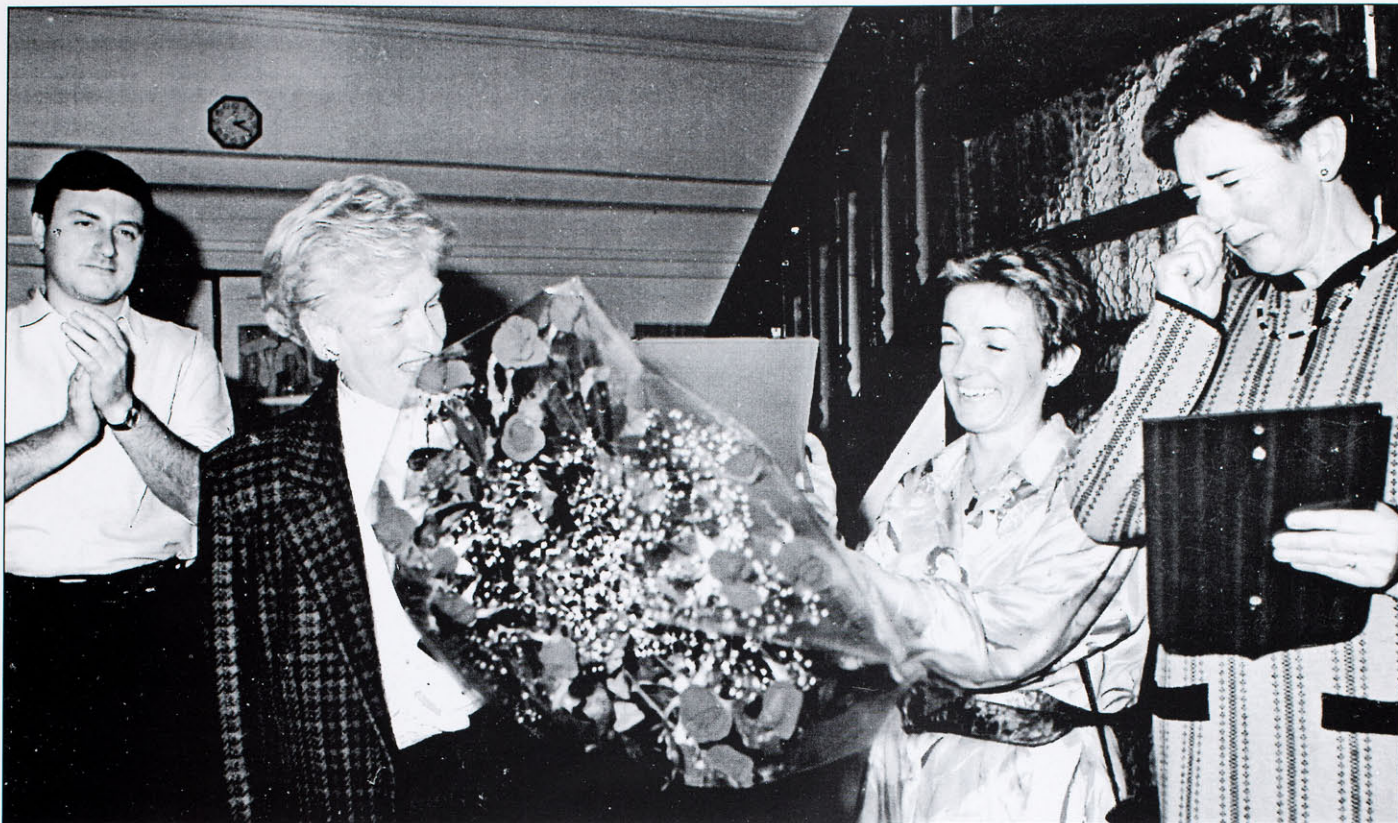
1993. urtea. Jubilazioaren ordua heldu da eta Kontxitik irakasle eta gurasoen omenaldia jasotzen du.