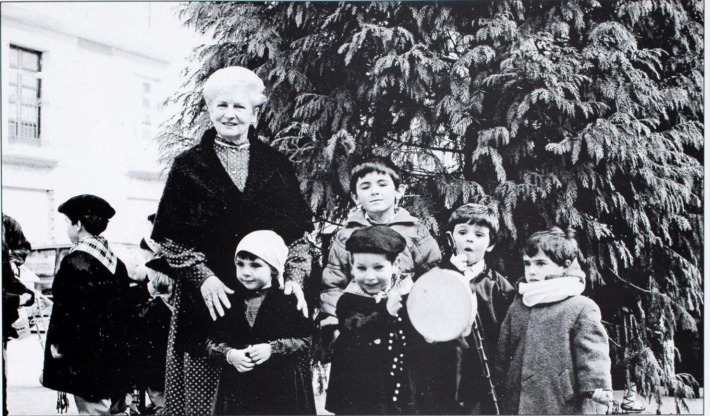
Santa Agedan, ume talde batekin ikusten dugu Kontxita. (Gaur egunean).