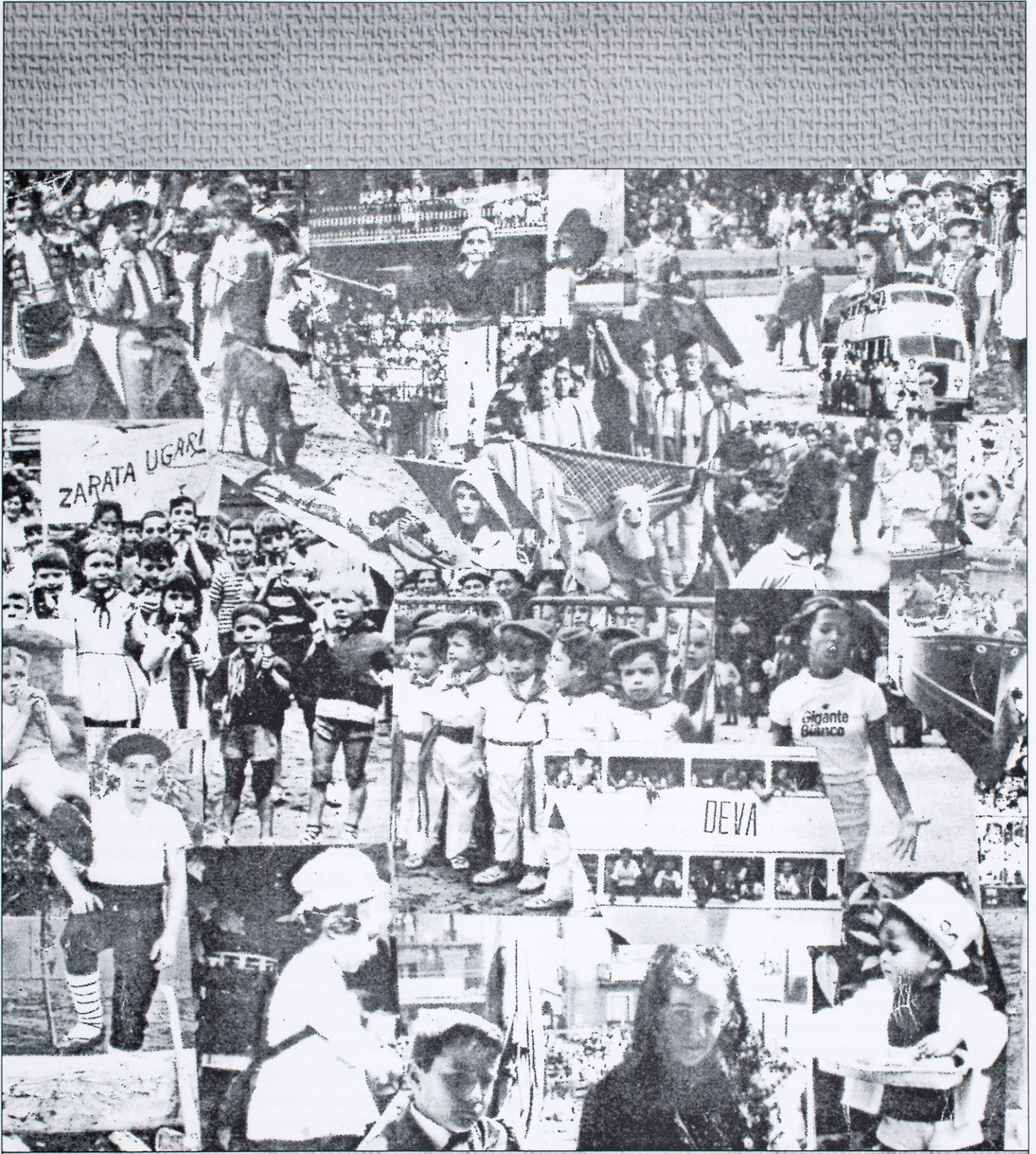
Kontxitarren oroipenari lotuta dauden eta umeen partehartzea jasotzen duten argazki ugari.