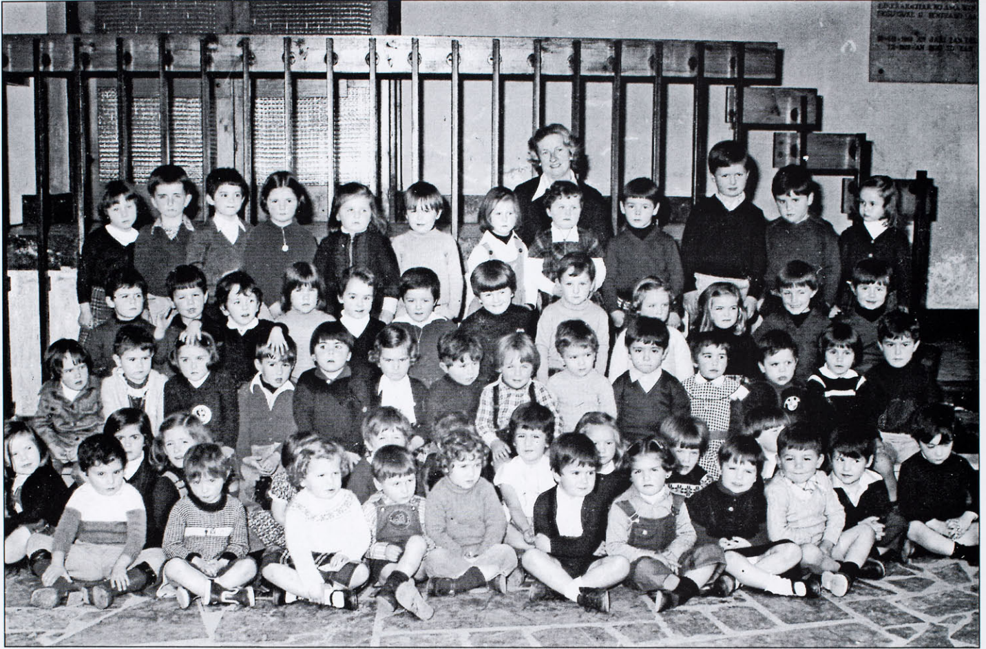
1980. urtea. Kontxita ikastolan bere kargu zituen ume talde batekin.