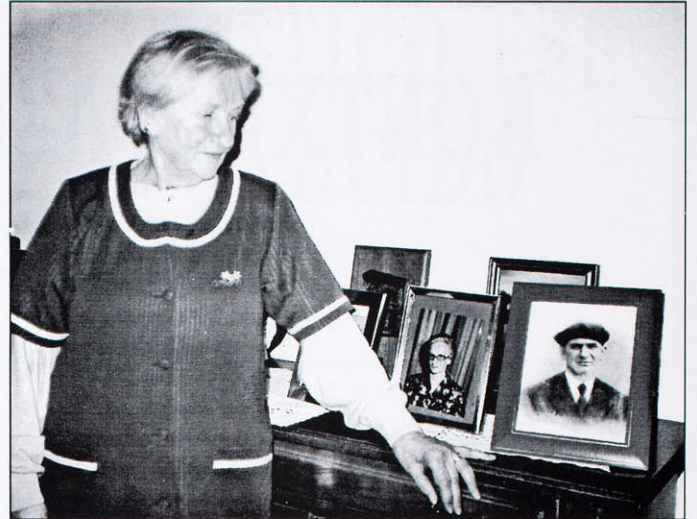
Kontxitak oroimen ezinobea gordetzen du bere gurasoek eta bien argazkiak gordetzen ditu maitasunez.