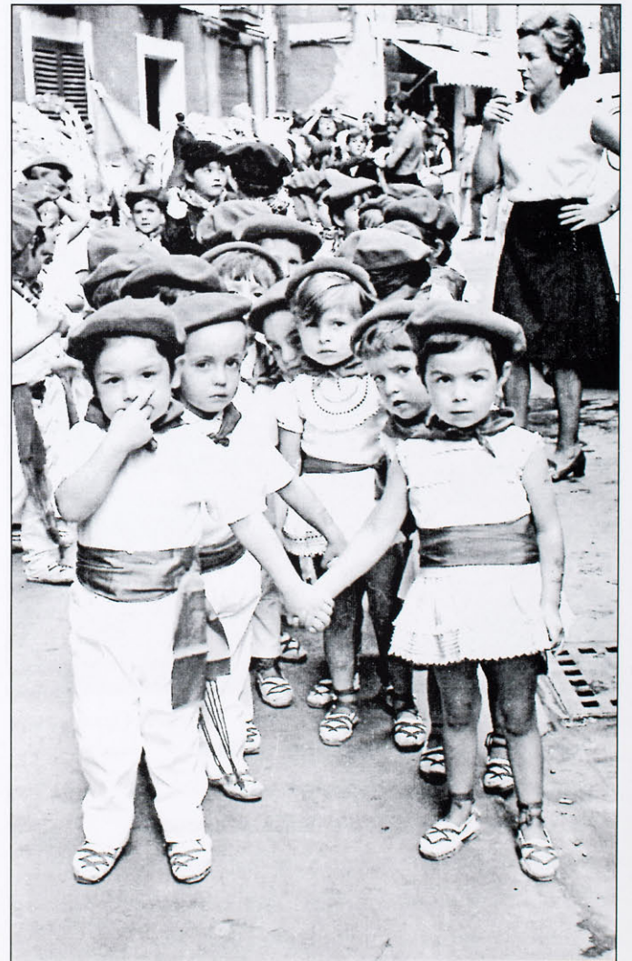
Kontxitak, lehenengo Umeen Egunean batean ume talde bat zuzentzen. (1970. urtean inguru)