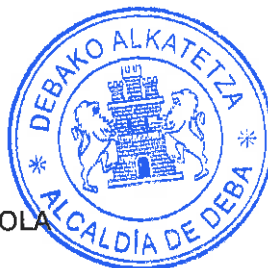
PEDRO BENGOTXEA LOIOLA DEBAKO ALKATEA