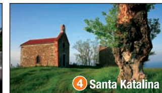
4 Santa Katalina