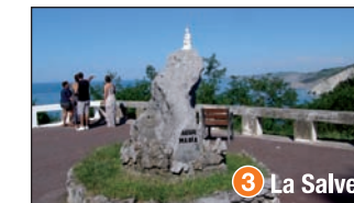
3 La Salve