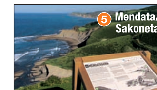
5 Mendata/ Sakoneta