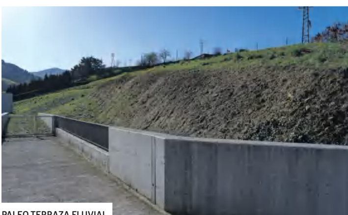
PALEO TERRAZA FLUVIAL

La excavación en el desmonte general a la altura de los nichos descubrió la denominada 'terrazza fluvial', elemento de gran interés geológico. Es una terraza fluvial situada a 40m claramente definida por una alineación de cantos rodados. Su estudio permitirá reconstruir el encajonamiento del río Deba y ayudar así a comprender y datar la evolución Del Valle junto con los estudios que el Geoparque de la Costa Vasca ha realizado en el Karst y la rasa mareal. Este tipo de paleo paleoterrazas colgadas son muy poco habituales en la vertiente cantábrica, ya que normalmente los procesos de erosión de las laderas terminan por destruirlas completamente.