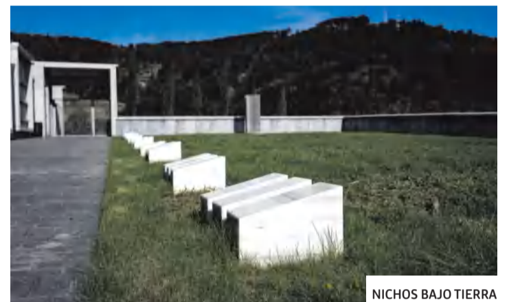
NICHOS BAJO TIERRA