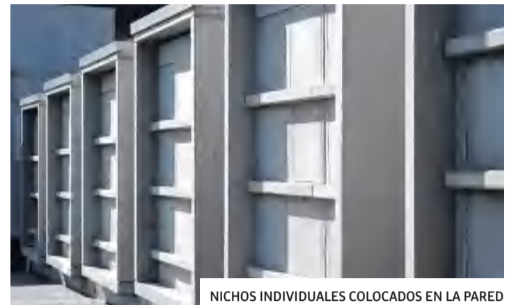
NICHOS INDIVIDUALES COLOCADOS EN LA PARED