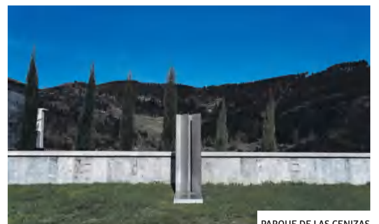
PARQUE DE LAS CENIZAS

El plazo de estancia será de cinco años en los dos casos. Una vez transcurrido el plazo, y siempre en función de las necesidades de espacio, se podrá prorrogar la estancia en el enterramiento cada año. Pasados los periodos de estancia los restos o cenizas no solicitadas por las familias se guardarán en el osario o parque de cenizas.