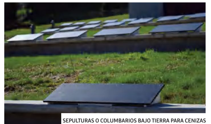
SEPULTURAS O COLUMBARIOS BAJO TIERRA PARA CENIZAS

Hay espacio para 972 urnas de cenizas en columbarios bajo tierra: 54 módulos por módulo de 18 unidades de capacidad.