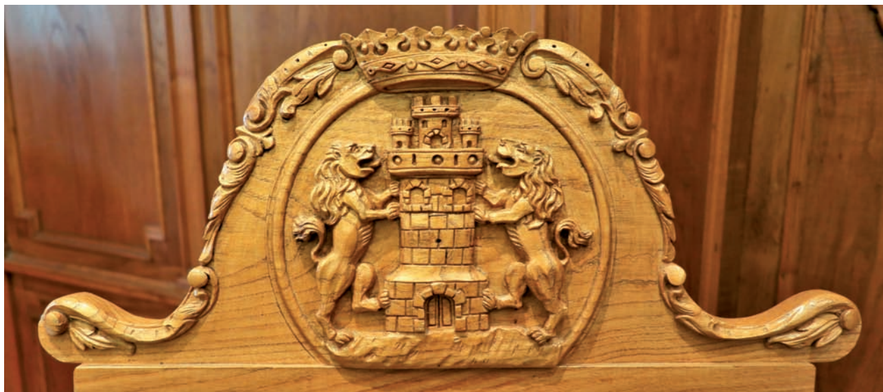
Debako armarria, egurrez egin, udaletzeko kapitulu-gelako alkatearen besaulkiaren buru-euskarrian. 2018ko abendua.

Udalak udal-armarri hau aipatutako brontzezko zigiluetan eta hareharrietan ez ezik beste hainbat euskarritan ere erabili izan du eta erabiltzen du, figura heraldikoak eta apaingarriak pittin bat aldatuta. Esaterako, burdinurtuan; beirate beruneztatuan, Santa Maria elizaren klaustroko sarrerako atearren gainean; egurrean, alkatearen besaulkiaren buru-euskarrian; oihal-bordatuetan, Udalak ekitaldi berezietarako erabiltzen dituen banderetan; brontzezko plaketan; udal-eraikinetako kare-harrietan; paper-mota guztietan; eta udal-departamentuek erabiltzen dituzten kautxuzko zigiluetan.