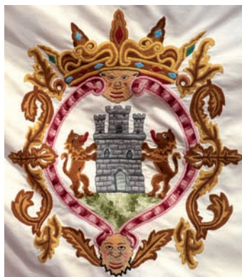
Debako armarria, oihalean bordatua, udaletxean dagoen banderetako batean. 2018ko abendua.