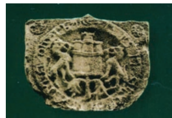
Deba hiribilduko armarrria, hareharrian landua eta herriguneko Santa Maria sortelizaren fatxadaren erlaitzean dagoena. Udalaren izaera merelegoa aldarrikatzen du.

1772ko irailaren 9ko aintzatespen eta deklarazio dokumentu batean eta Gaztelako Ganberaren aginduz, alderatu egiten dira hiribilduko Santa Maria elizaren fatxada nagusiaren erlaitzean dagoen harrizko armarrria eta garai haietan Udalak bere gutunak, idatzagiriak eta antzeko dokumentuak zigitatzeko erabiltzen zuen brontzezko “zigilua”. Ondorio hau atera zuten: biak eremu zirkularrean daude eta berdina dira blasoiei dagokienez. Brontzezkoak “gaztelu bat du haitzen gainean eta, gazteluaren bi alboetan, lehoi bana daude, eraso egin nahiko balute bezala, eta lehoi bakoitzak atzapar bat du almenen kantoiari helduta”, eta lehoiak “gubilaz eginak daude xehetasun handiz: lehoien mihia, ahoa, ileak, kalparra, isatsak eta hanken saihetsak antzematen dira”.