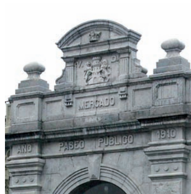
Debako armarria, pasealeku estalira sartzeko sarrera nagusiaren portalearen frontoian kokatua eta duke-koroaz tinbratua, udal-eraikin zibiletan kokatu ohi diren modukoa. 2003ko urtarila.

Duke-koroaz eta bi palmez tinbratua dago; palmak, bilduta eta dekoratuta, bi aldeetan bana daude eta behealdean elkartzen dira. Lema honek inguratzen du: «DEBAKO HIRI UDALETXEA» goialdean eta «AYUNTAMIENTO DE DEBA» behealdean. Eremuan, hiribilduaren armarria.