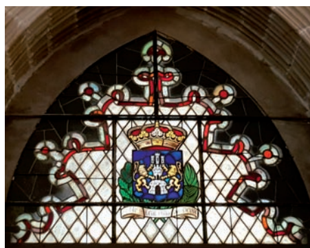
Debako armaria beirate beruneztatuan, Santa Maria elizako erdiko nabetik klaustorra sartzeko arkuaren espazioa betez, atean gainean. 2013ko uztaila.

Harrizko armarrarian, berriz, “gaztelu bat dago erdian, baina ez dira haitzak ikusten gazteluaren oinean, sastraka moduko bat baizik, hortik adarrak bi alboetara berdin erortzen direlarik, erdiko enborra baino handiagoak diren adarrak gainera. Lehoiek oinarri edo idulki moduan baliatzen dituzte adarrak, eta gaztelua erasotu nahiko balute bezala ageri dira baita ere, eta lehoi bakoitzak atzapar bat du almenen kantoari helduta”. Erlaitzeko armarrariaren ertzeko inskripzioa argi ez badago ere, Kabildoaren enkarguz antikuario batek hiru aldiz modu berean irakurri zuen inskripzio hau: “hauek dira hiribilduko armak”.