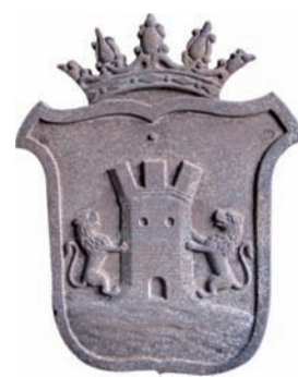
Deba hiribilduko burdinurtuzko armaria, udal-lokaletan dagoena. 2012ko otsaila.