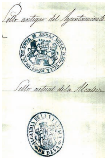
Deba hiribilduko armen zigiluak. Goikoa zaharragoa eta behekoa 1876koa. AHN.