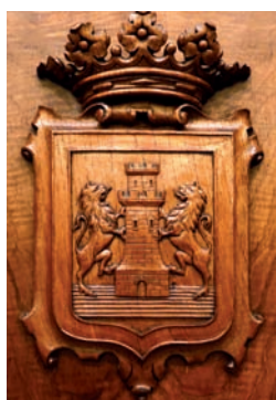
Debako armaria, egurrez egina eta forratua, presidentea esertzen den lekuaren atzealdean, udaletxeko kapitulu-gelan. 2018ko abendua.