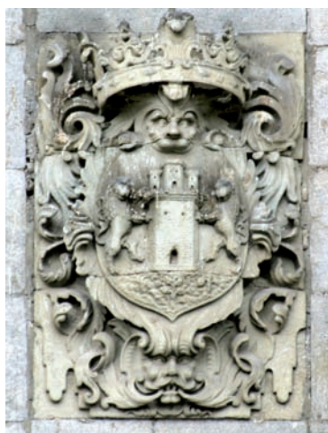
Debako armaria, udaletxeko fatxada nagusian dagoena. Hiruko multzoaren ezkerrekoa da. 2014ko uztaila.