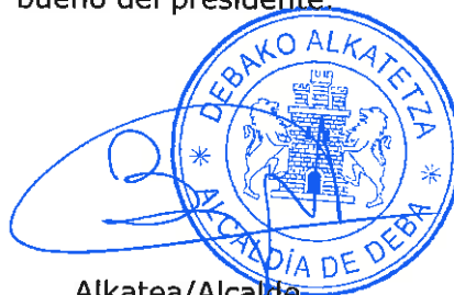
Alkatea/Alcalde Pedro Bengoetxea Loiola

Sin más asuntos que tratar terminó la reunión a las 20:45 horas. Para que conste lo tratado y acordado redacto y firmo este acta con el visto bueno del presidente.